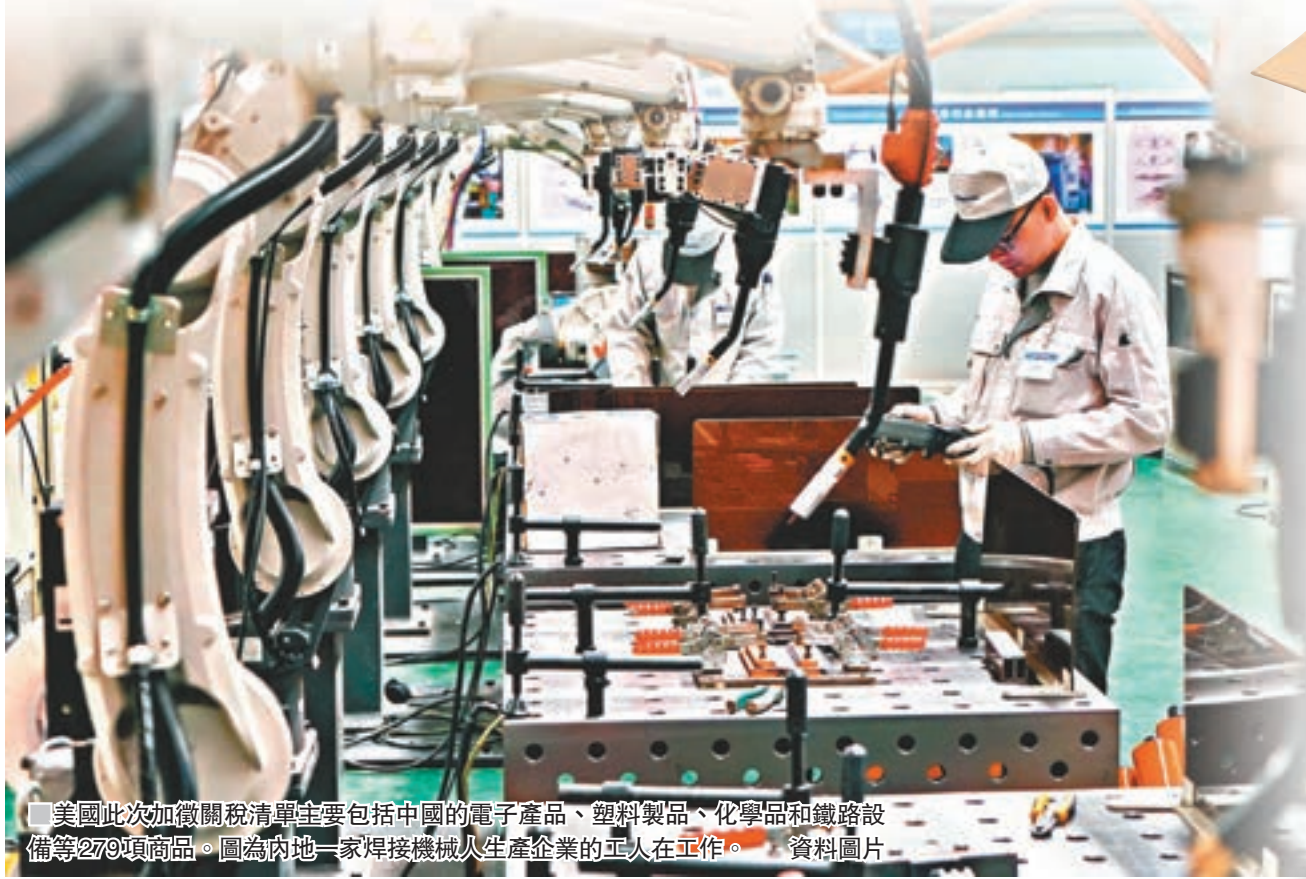
美國此次加徵關稅清單主要包括中國的電子產品、塑料製品、化學品和鐵路設備等279項商品。圖為內地一家焊接機械生產企業的工人在工作。

香港文匯報訊(記者 馬琳 北京報道)美國在加劇中美貿易摩擦方面越走越遠。據外媒報道,美國貿易代表辦公室北京時間8日正式公佈了針對160億美元中國商品加徵25%關稅清單,包括279項商品,將從8月23日開始徵稅。新清單較此前減少了5項,美方對此解釋為相關商品加徵關稅「可能對經濟造成嚴重傷害」。對此,中國商務部昨日回應稱,為維護自身正當權益和多邊貿易體制,中方不得不作出必要反制,決定對160億美元自美進口產品加徵25%的關稅,並與美方同步實施。