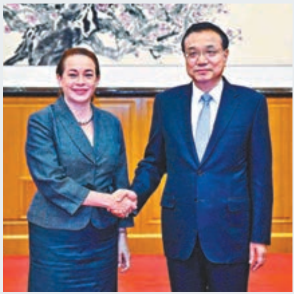
李克強在北戴河會見埃斯皮諾薩。

主義的世界。各國應維護以規則為基礎的國際秩序,恪守聯合國憲章的宗旨和原則,堅持通過對話協商解決分歧。維護世界貿易組織基本規則,堅持並完善自由貿易體制,促進貿易和投資自由化便利化。推動國際關係民主化和法治化,反對保護主義。 埃斯皮諾薩表示,聯合國高度重視同中國的關係。又表示自己作為第73屆聯合國大會主席首次出訪就選擇中國,就是看到中國在加強多邊主義方面發揮的重要作用,以及支持聯合國工作所作的巨大貢獻。聯合國願同中方以及世界各國共同維護以規則為基礎的國際秩序,促進在國際法和世界貿易組織框架下的自由貿易,推動包容、惠及所有人的經濟全球化,攜手應對挑戰,促進世界和平穩定與發展繁榮。