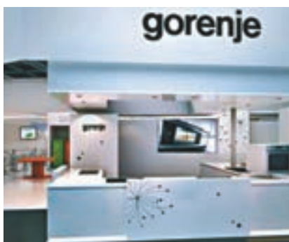
歌爾品牌知名度高,在歐洲擁有完整的銷售體系。

香港文匯報訊 據環球網引述 Business Review 消息,繼上個月斯洛文尼亞監管機構正式批准中國家電領導品牌海信集團收購斯洛文尼亞白電製造商歌爾(Gorenje)之後,這一收購計劃日前得到歐盟委員會的批准。這兩家家用電器製造商的合併將有效推動海信集團全球化的進程。 歐盟委員會日前宣佈,經過全面調查,歐盟認為海信收購歌爾沒有違反任何國際法律法規,不會構成行業壟斷,也不會引發行業惡性競爭,因此,歐盟委員會宣佈批准這一收購交易。 歌爾有完整歐洲銷售體系 據早前斯洛文尼亞證券市場機構ATVP公佈的信息顯示,此次海信成功收購歌爾95.42%的股份。歌爾成立於1950年,在廚電和洗衣機等產品方面有較強的實力,品牌知名度較高,並在歐洲擁有完整的銷售體系。 近年來,面對不斷加劇的市場競爭壓力,歌爾的產品銷量開始出現不同程度的下滑,僅2017年,該公司的淨利