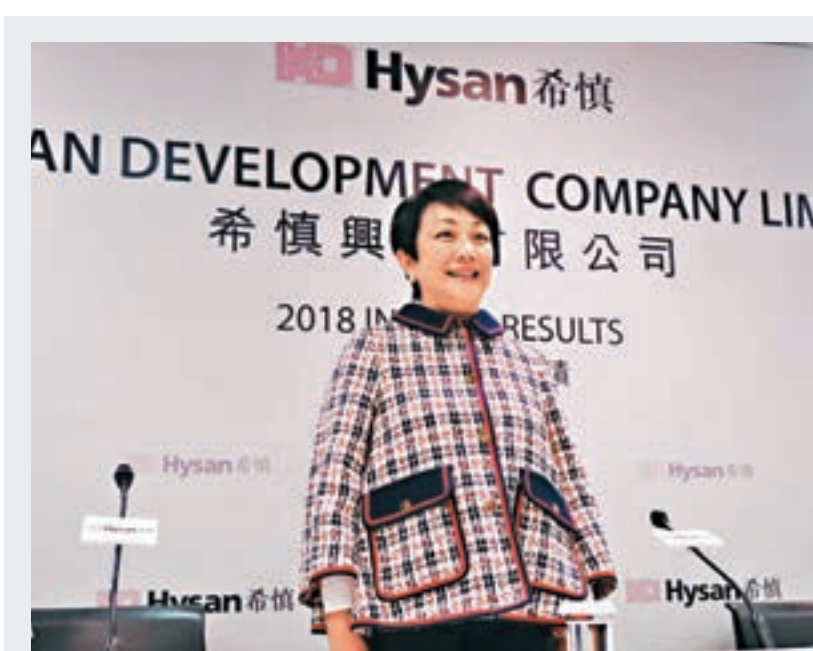
利蘊蓮指,公司正刻意針對部分商舖作調整,相信可滿足未來5至10年的發展。

賀樹人又透露,利園三期目前出租率良好,辦公室有95%已經出租,餘下的相信也會很快租出,而零售商場亦已經出租約90%的店舖,預計2019年為公司提供3億元至3.5億元的收入。