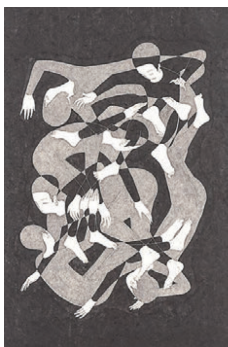
Borderline personality disorder, Korean ink on Korean paper, 72 x 48cm, 2018

在傳統東亞藝術與現代生活之間尋找平衡一直是他對藝術探索所關注的領域。他自言經常從自己的人生經歷、內心的思想和感受中吸取見解和靈感，而這些內心反思的視覺表達以及與觀眾分享這些內容的願望引發了他自2008年以來開始至今的一系列「Moonassi 繪畫作品」。「Moonassi」這個詞，在韓語中主要來自兩個字，「moon」是「空」的意思；而「na」意味着自我或自我意識。