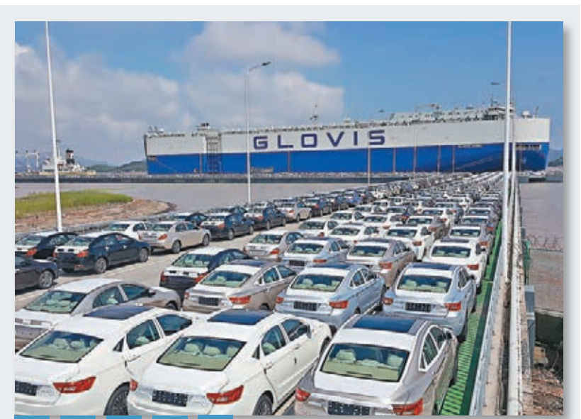
外貿滾裝船 8月4日17時30分，在浙江寧波舟山港梅山港區西滾裝碼頭，一輛輛嶄新的國產汽車井然有序地駛入「GLOVIS SONIC」滾裝船中。據悉，該船是寧波舟山港今年掛靠的首艘外貿滾裝船，將裝載850輛吉利汽車出口至沙特和埃及。

香港文匯報記者登陸商洛市食品藥品監督管理局網站看到，該網站8月1日刊發了一篇題為「商洛食藥局加強疫苗質量監管 確保群眾接種安全」的稿件。其中提到，長春長生疫苗事件曝光後，商洛市食藥監局迅速安排，於7月24日下發了《關於做好疫苗安全風險防控的緊急通知》，經核實，該市疾控中心未購進國家通報的問題批次疫苗。同時經過對各市縣區疾控中心近3年來疫苗購進、分配、冷鏈運輸、儲存、銷售環節情況檢查，未發現異常現象。該局同時還要求各縣區局重點檢查疫苗使用單位質量管理制度的執行情況，以及接種、儲存、運輸中冷鏈記錄管理等情况，確保疫苗使用安全有效。