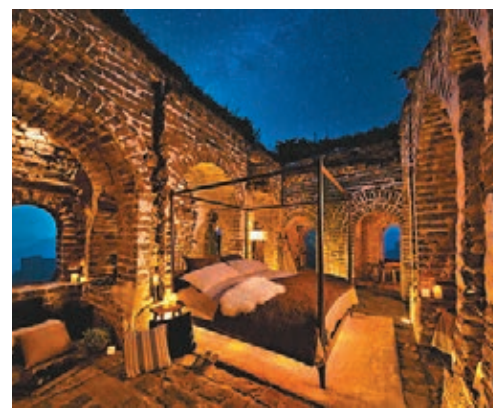
■Airbnb 已明確提醒報名者在住宿期間的活動要以保護文化遺產為首，嚴禁跑跳吵鬧。圖為其佈置示意圖。