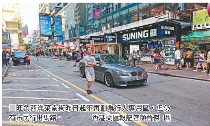
旺角西洋菜南街昨日不再劃為行人專用區，但仍由市民行出馬路。香港文匯報記者顏晉傑攝

街上的行人過路處亦有大批警員及交通督導員執勤，香港文匯報記者在現場觀察，不少未有按交通燈號過路或行出馬路的市民都被截停。有交通督導員透露，未來一段日子會加強在西洋菜南街巡邏，加強教育工作，指該處多年來都是行人專用區，市民暫時未必清楚新安排，所以未必會即時檢控。