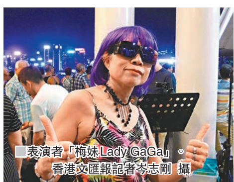
表演者「梅妹Lady GaGa」。

昨日是西洋菜街行人專用區「殺街」後首個周末，過去在菜街的表演者，不少轉戰天星碼頭繼續演唱。現場所見，約有四個至五個疑似旺角歌舞團在下午3時起陸續抵達，帶備揚聲器和電子琴等樂器，霸佔天星小輪出入口處有蓋地，繼續高唱「金曲」。