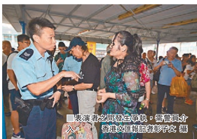
表演者之間發生爭執，需警員介入。