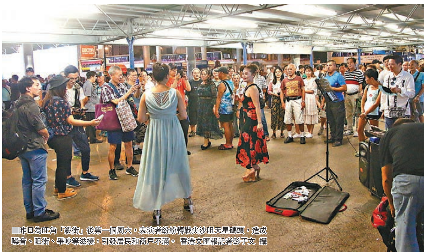
昨日為旺角「殺街」後第一個周六，表演者紛紛轉戰尖沙咀天星碼頭，造成噪音、阻街、爭吵等滋擾，引發居民和商戶不滿。

在菜街表演了三年多的「梅妹Lady GaGa」，昨晚首次到達尖沙咀海濱長廊。她形容，地方非常空曠，又臨近海邊，不用擔心會騷擾民居。她認為，市民大眾對他們的表演感到厭惡，源自於近年旺角有害群之馬，不但表演質素差劣，更互相鬥大聲。她建議政府應該推出措施規管表演者，不單要限制表演音量，亦要規管他們賺取小費的行為。