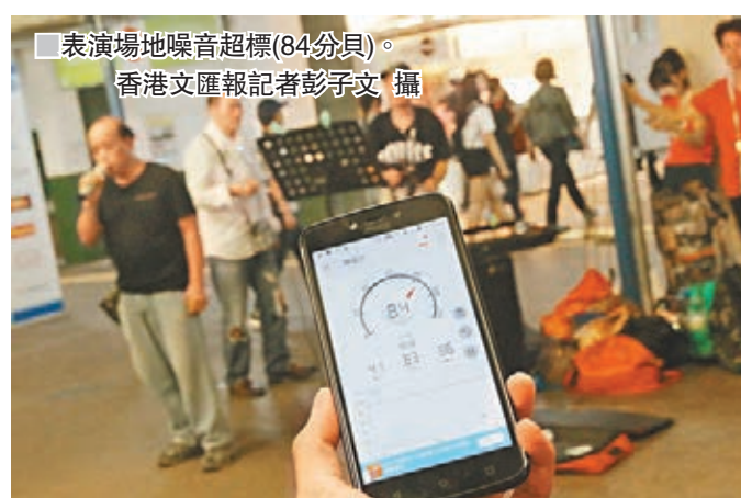
表演場地噪音超標(84分貝)。