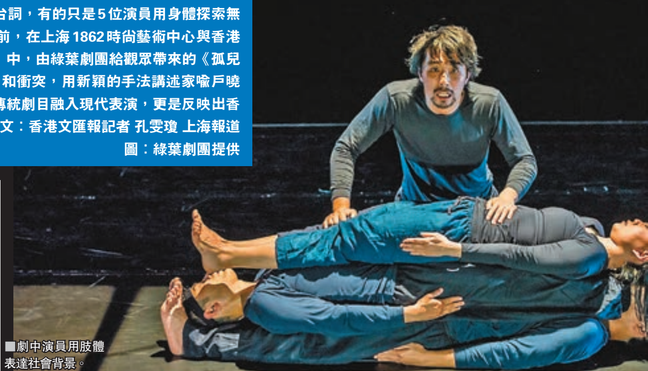
劇中演員用肢體表達社會背景。

阿苑提到，1.0和2.0最大的區別首先是演員的不同，歐洲版本演員都是西方人，但因中西方文化的差別，肢體表達出的意味相差頗大。回國之後，導演分別找到香港和內地的演員，用中國人的肢體語言來上演一齣升級後的《孤兒2.0》。即使是同為中國演員的香港、內地雙方，文化亦有顯著區別，內地演員具有原始的爆發力，香港演員則偏向思考型，正是基於文化衝擊和碰撞，兩邊演員更能在表達故事的時候充滿深度。