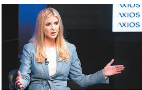
伊萬卡前日表示，不認為傳媒是人民公敵。

擊，與美國尊重新聞自由及國際人權法的義務背道而馳，增加記者遭受暴力攻擊的風險。他還呼籲華府勿藉着控告記者以追查消息來源，並停止利用《間諜法》追尋爆料者。