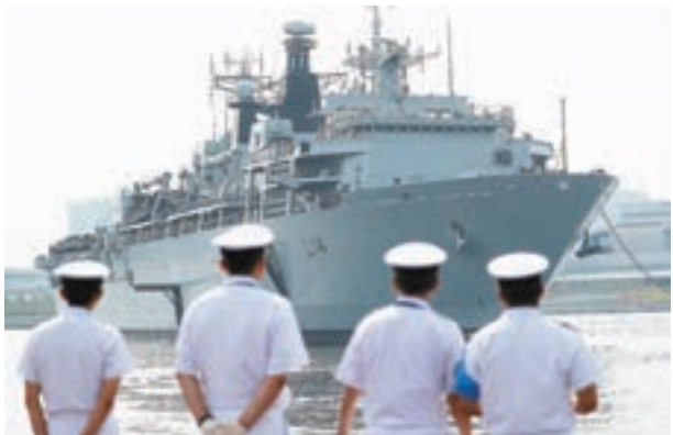
英海軍「海神之子」號昨日抵達東京停泊。路透社

英國海軍兩棲攻擊艦「海神之子」號昨日抵達日本東京停泊，令英海軍在日本海域的活動時間延長至4個月，反映兩國加強軍事合作。路透社分析指出，英國脫歐在即，加上亞洲經濟蓬勃發展，英國一方面尋求與中國有更緊密經濟連繫，同時深化與日本的國防合作，藉此擴大在亞洲的影響力。