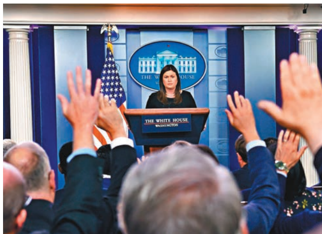
白宮發言人桑德斯表示，特朗普已經給金正恩回信，並將很快發出信件。