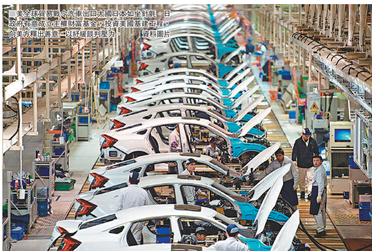
美全球貿易戰令汽車出口美國日本如坐針氈。日政府有意成立主權財富基金，投資美國基建工程，向美方釋出善意，以紓緩談判壓力。

《日經》報道，主權財富基金的規模尚未確定，日本政府可能最快明年4月透過發債，在私人市場集資，並希望利用日本央行超寬鬆貨幣政策的優勢，以發行零息長債集資為目標。當日圓升值時，例如兌美元匯價突破100日圓兌1美元水平，基金將把籌得的資金轉為外匯，以免日圓過強，但報道指此舉可能被批評為操縱匯價。日本內閣最快本月內成立委員會，討論有關成立基金的提議。