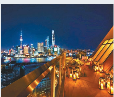
修繕後的大樓外立面得以保留，斜面元素是其經典標誌。