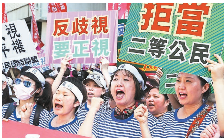
中國國民黨台北市長參選人丁守中日前質疑陸配與外籍配偶的待遇不平等。圖為陸配爭取權益。

不平等措施，除了取得身份證件的年限長，還有入籍年滿10年後才能獲得參選公職的權利。