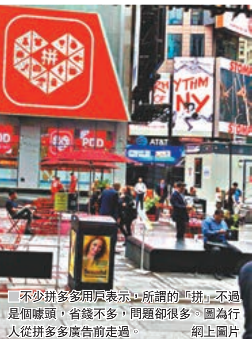
不少拼多多用戶表示,所謂的「拼」不過是個噱頭,省錢不多,問題卻很多。圖為行人從拼多多廣告前走過。網上圖片