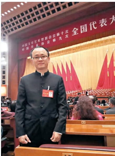
■黃志強參加中國作家協會代表大會。