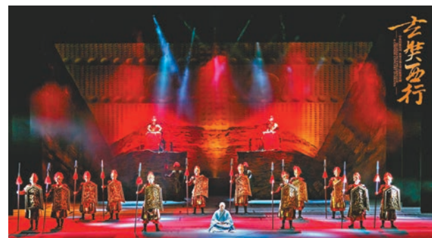
中央民族樂團是海內外規模最大、藝術最完備的綜合性國家級民族音樂表演團體。

第十九屆「香江明月夜」慶中秋活動在9月21日起演出。今年將由中央民族樂團演出民族器樂劇《玄奘西行》，以下將向大家介紹演出樂團。