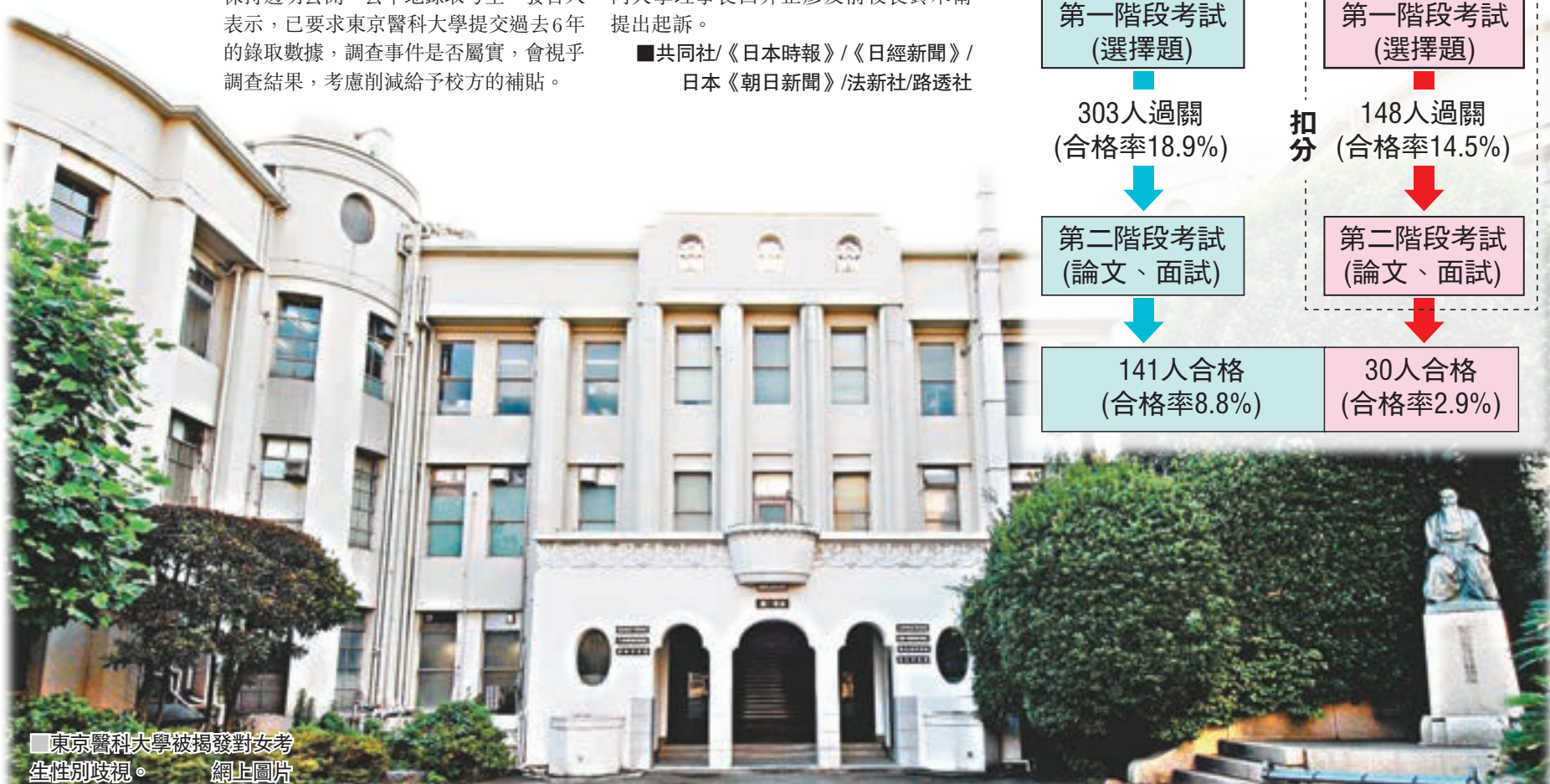
東京醫科大學被揭發對女考生性別歧視。網上圖片