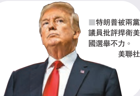
■特朗普被兩黨議員批評捍衛美國選舉不力。

該中心由流亡英國的俄羅斯反對派人物、前首富霍多爾科夫斯基成立，中心總編輯指出，案件表面上是劫殺案，但懷疑遇襲原因涉及他們的調查工作。