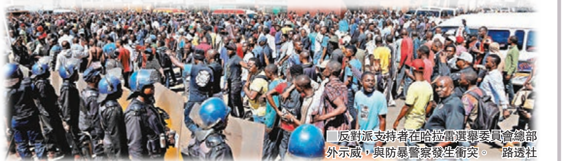
反對派支持者者在哈拉雷選舉委員會總部外示威，與防暴警察發生衝突。路透社

內政部長姆波富批評查米薩提早宣稱勝選，企圖煽動暴力，強調無人能凌駕法律，保安部隊會維持高度戒備。 ■路透社/法新社