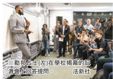
■勒邦占士(左)在學校揭幕的記者會上回答提問。

克隆宣佈成立了名為「I Promise School」(我承諾學校)。學校開辦頭一年將招收240名三年級和四年級學生，並預計到2022年擴展至招收一至八年級學生。占士幼時與母親為生計經常搬家，小學四年級一度輟學82天。他表示，開辦這所學校是他「一生中重要的時刻之一」，目的是幫助像他一樣的孩子學習。