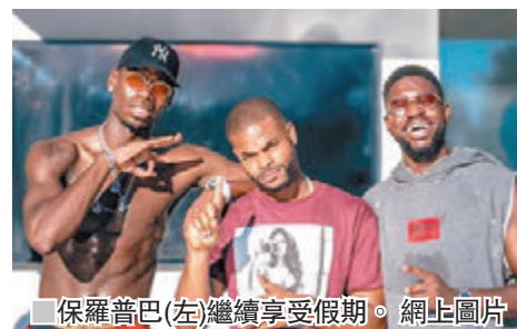
■保羅普巴(左)繼續享受假期。

曼聯領隊摩連奴近日暗怨高層撥款增兵不力，又指隊中踢畢世界盃的國腳球員應該自發提早結束休假，歸隊備戰下星期尾便開