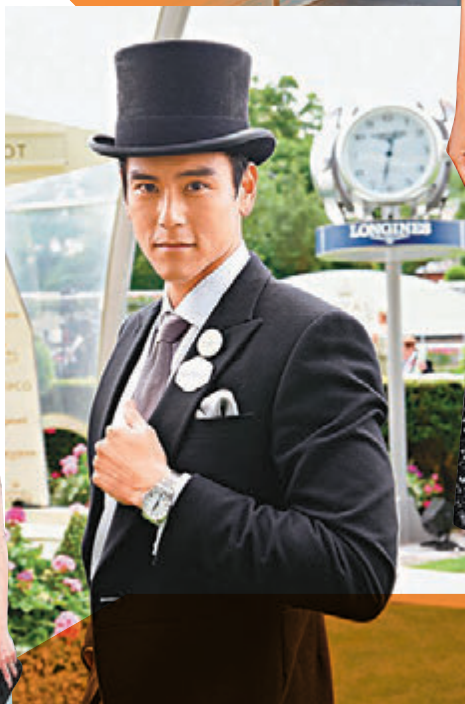
彭于晏佩戴Longines全新腕錶