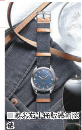
歐米茄牛仔版鐵霸腕錶

1957 年原創的歐米茄鐵霸腕錶設計穩重可靠，防磁性能卓越，適合當時的藍領人士日常佩戴。為向昔日的工業時代致敬，這款經典腕錶現推出全新款式，其靈感源自牛仔布物料，造型獨特。今年，品牌特別構思了直紋磨砂「藍色牛仔布」紋理表面，使經典的牛仔布與新版鐵霸腕錶渾然為一，再配上經淺灰色夜光塗層處理的小時刻度及指針，造型醒目脫俗。錶面飾有米色「棒棒糖」狀的中置秒針和「Railmaster」（鐵霸）字樣，兩者均仿效牛仔褲上的彩色縫線。