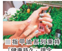
指甲油系列秉持「健康持久」理念

而且，指甲油系列秉持「健康持久」的品牌理念，強調純天然成分。為保障用家健康安全，有 7 大無添加保證——不添加對人體有害成分的有毒物質包括甲醇、甲醛、甲苯、樟腦、DBP、甲醛樹脂以及丙酮等，無毒不具腐蝕性，不傷指甲。女士們選用品牌的指甲油後，從此不用擔心，每天都能換迎新顏色。指甲油中添加甘油和維他命 E 滋潤甲面，上色時手感順滑，一刷就能展現光亮水潤透澤感，用家能輕易塗出美甲店的效果。