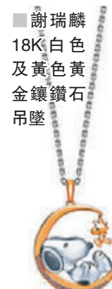
謝瑞麟 18K 白色及黃色黃金鑲鑽石吊墜