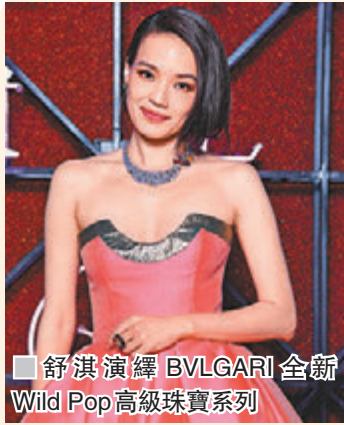
舒淇演繹 BVLGARI 全新 Wild Pop 高級珠寶系列

BVLGARI 呈獻全新 Wild Pop 高級珠寶系列，系列令人出乎意料的創作風格，是經典的品牌作風。設計靈感來自華麗的 1980 年代，由 disco 音樂到普普藝術，向這個時代的強勢、自由和實驗性致敬，同時也向 BVLGARI 與 Andy Warhol 之間的特殊關係致敬。然而，這一點靈感只不過是個起點，因為新 Wild Pop 是打破現代規範的前衛系列，百變的感性風貌照亮了今日以至未來的珠寶世界。