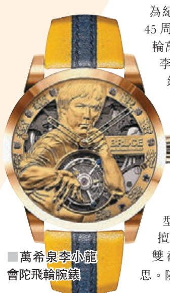
萬希泉李小龍會陀飛輪腕錶

為紀念李小龍逝世 45 周年。香港陀飛輪萬希泉第二次與李小龍會合作，繼續宣揚香港精神，品牌推出李小龍會陀飛輪腕錶，腕錶的各個細節一絲不苟，指針的造型參考李小龍最擅長的武器——雙截棍，別具心思。隨時間的流逝，