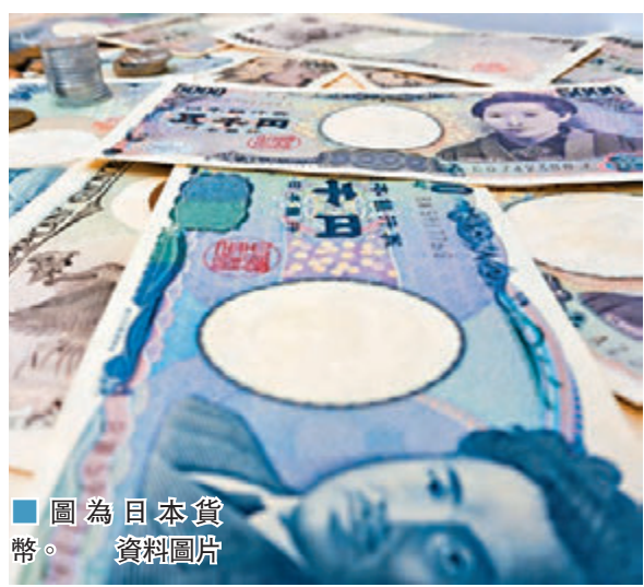
圖為日本貨幣。

日圓兌美元周二走軟，此前日本央行承諾維持利率在低位，並採取前瞻指引模式，以強化對大規模政策刺激的承諾，令原本擔心日本央行將暗示縮減刺激的市場人