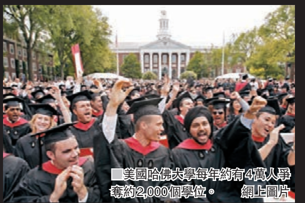
美國哈佛大學每年約有4萬入學申請人，約2,000個學位。

美國哈佛大學因為涉嫌在收生過程中不公平對待成績較好的亞裔學生，被指涉嫌「逆向種族歧視」，早前遭到入稟起訴，日前公開的法庭文件進一步披露了哈佛入學程序的黑暗，學校收生職員被指會利用「枯枝」、「貼士」、「院長有興趣」、「DE」和「Z名單」等代號，暗中分類入學申請，擁有入際關係的申請人將較易獲取錄。個別學生即使在學術能力評估測試(SAT)取得高分，更獲入學部門評為「要與普林斯頓大學競爭」的人才，最終卻名落孫山。