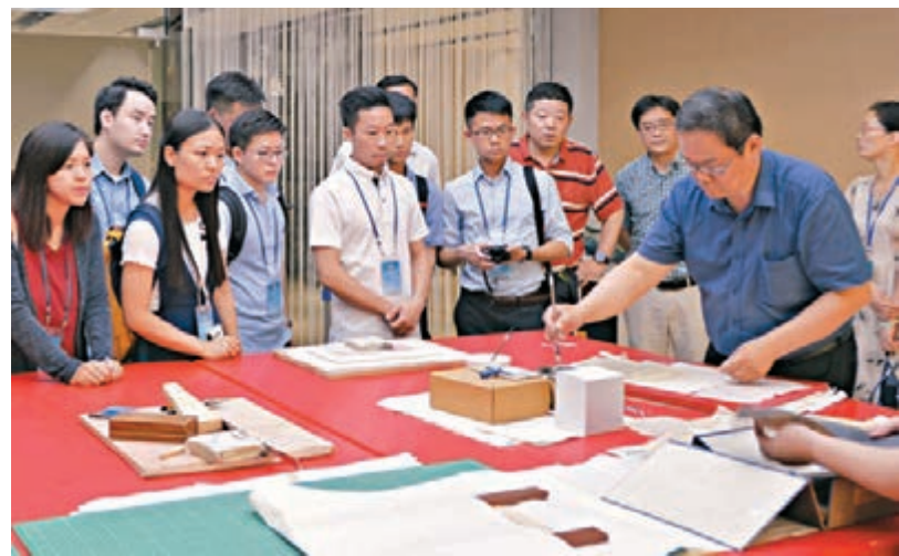
團員參觀南京中醫藥大學,觀摩古蹟修復。

路」和粵港澳大灣區發展帶來的機遇,取得成長和發展;也希望這次考察中與江蘇建立起來的友誼能夠轉化為合作,為推動兩地青年交流多作貢獻。