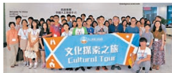
團員到訪「中國人工智能小鎮」。

此外,亦到訪余杭區「夢想小鎮」,認識內地青年創新創業者如何在小鎮內實現夢想,更順道遊覽聞名中外的杭州西湖,細味其豐富的歷史文化。