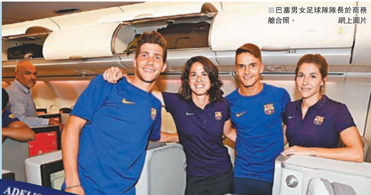
■巴塞男女足球隊隊長於商務艙合照。