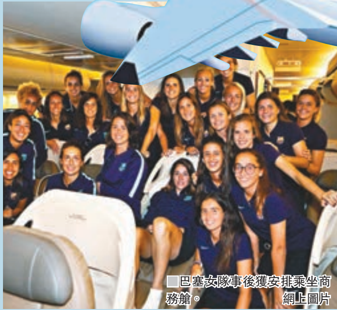
■巴塞女隊事後獲安排乘坐商務艙。