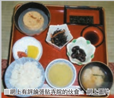
■網上有評論張貼寺院伙食。

日本佛教聖地高野山自2004年被列入世界遺產後，吸引大量遊客湧至，原本只接待僧人的寺院宿坊亦對外開放，讓旅客體驗寺院生活，但其中一間寺院赤松院的宿坊，最近便因為住客不滿寺院齋菜「粗茶淡飯」，在訂房網站留下負評，結果竟與負責回應的僧人爆發罵戰。