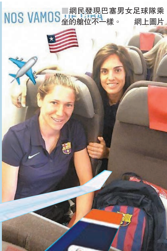
■網民發現巴塞男女足球隊乘坐的艙位不一樣。網上圖片