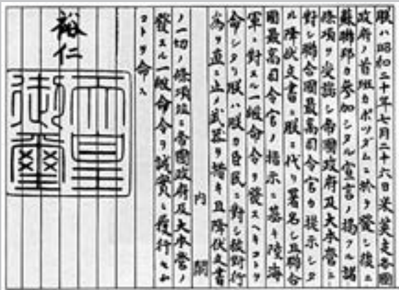
■日皇裕仁1945年8月15日宣佈無條件投降。