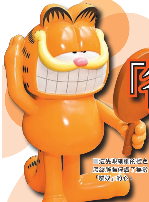
這隻眼細細的橙色黑紋胖貓俘虜了無數「貓奴」的心。