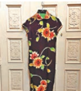
蒙師傅展出的長衫作品。