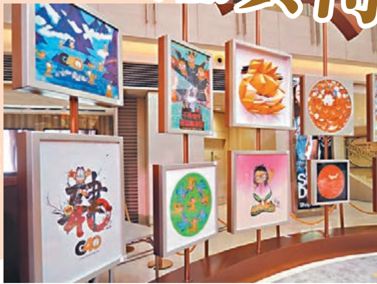
本次展覽還請了不同背景的藝術家一起創作以加菲貓為題材的作品。

在1978年6月19日，加菲貓系列漫畫正式於報紙上連載。自此，圍繞加菲貓、主人阿北、狗仔阿的三位主角之間的生活故事，吸引了全球過億的讀者，至今漫畫已在全球超過2,100份報紙連載。加菲貓的性格懶惰調皮，喜愛吃千層麵，也和大部分打工仔一樣有「Monday blue」。Jim表示，原來加菲貓的性格設定是源自他身邊不同的人——包括他自己。「我也十分喜愛吃千層麵，閒時也會喝喝紅酒，當然加菲貓不喝酒啦！」不過，Jim和加菲貓最不同之處是Jim所度過的每一個Monday從來不「blue」。「我很喜愛星期一，我的星期一就是坐在辦公桌上思考如何畫畫。」因為加菲貓與「憂鬱的星期一」畫上了等號，因此Jim笑言現時每到星期一，加菲貓facebook專頁上的帖子就會特別多「like」與「share」。「但牠總不能常常都討厭星期一啊！」Jim笑說。四十年來，加菲貓的形象深入民心——小小的、看上去帶點生氣的眼睛，圓滾滾的、肥胖身軀的貓便誕生了。不說不知，我們現在眼看的加菲貓是橙色的，但原來Jim當年構思加菲貓的顏色時，所用的其實是一種叫federal yellow的顏色，原來這與我們平時所見的馬路上的黃線有關。「當時政府有研究過哪一種顏色是最易吸引人的眼睛，原來就是這種『federal yellow』。」所以Jim在創作時便決定用這種顏色，「最易讓讀者看到囉！」他說。心水清的讀者或會發現，多年來，加菲貓的外形一直在改變。「最初是一對小小的眼睛，身子圓圓的像個球。但後來漫畫變得細格了，所以貓兒也就縮小了，為了讓讀者看得更加清楚，便稍稍放大了眼睛和嘴巴。到後來變成動畫後，加菲就變得又懂走路，又懂拿東西，所以我就把牠的身體變得更圓更