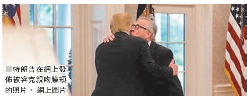
■ 特朗普在網上發佈被容克親吻臉頰的照片。 網上圖片