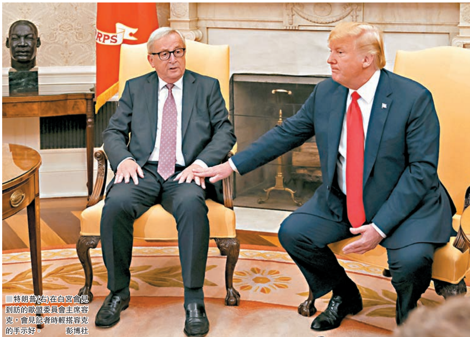
■ 特朗普(右)在白宮會見到訪的歐盟委員會主席容克，會見記者時輕搭容克的手示好。

美國智庫「大西洋理事會」全球商業與經濟計劃主任烏斯特維德表示，歐美避免貿易戰即時爆發，不代表問題已解決，雙方只是重回基本磋商階段，加上大豆和液化天然氣並非最重要的貿易商品，相信若華府不撤回鋼鋁關稅，歐盟亦不會作太多讓步。 ■路透社/法新社/美聯社/《華盛頓郵報》/《衛報》