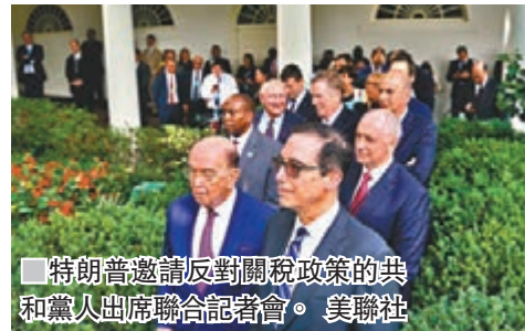
■ 特朗普邀請反對關稅政策的共和黨人出席聯合記者會。

不過，特朗普在聯合聲明中並未排除對進口汽車徵收關稅，田納西州參議員亞歷山大和亞拉巴馬州參議員瓊斯均計劃提出法案，阻止特朗普對汽車加徵關稅。科羅拉多州參議員加德納表示，中期選舉結果將取決於選民能否看見美國經濟增長，而關稅措施正為經濟帶來風險。 ■《華盛頓郵報》