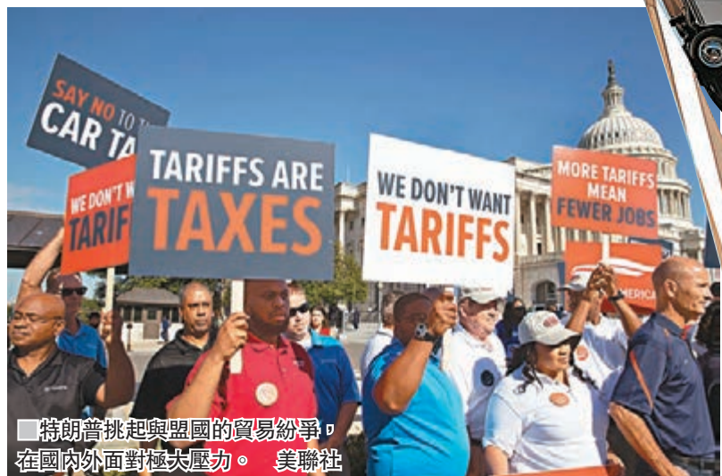
■ 特朗普挑起與盟國的貿易紛爭，在國內外面對極大壓力。