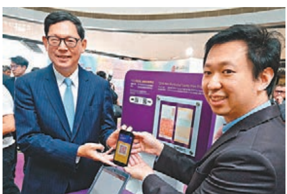
金管局總裁陳德霖昨出席「2018香港新鈔票系列」巡迴展覽。

香港文匯報訊（記者 馬翠媚）本港年底將陸續推出一系列新鈔，金管局連日出招為新鈔進行宣傳，除在面書拍片介紹新鈔6大防偽特徵及主題、在全港舉行巡迴展覽，更推出手機應用程式「2018尋鈔記」。金管局總裁陳德霖昨出席中環展覽時表示，程式設有不同遊戲，包括增強實境遊戲、尋寶遊戲及拼圖遊戲，旨在宣傳新鈔知識。