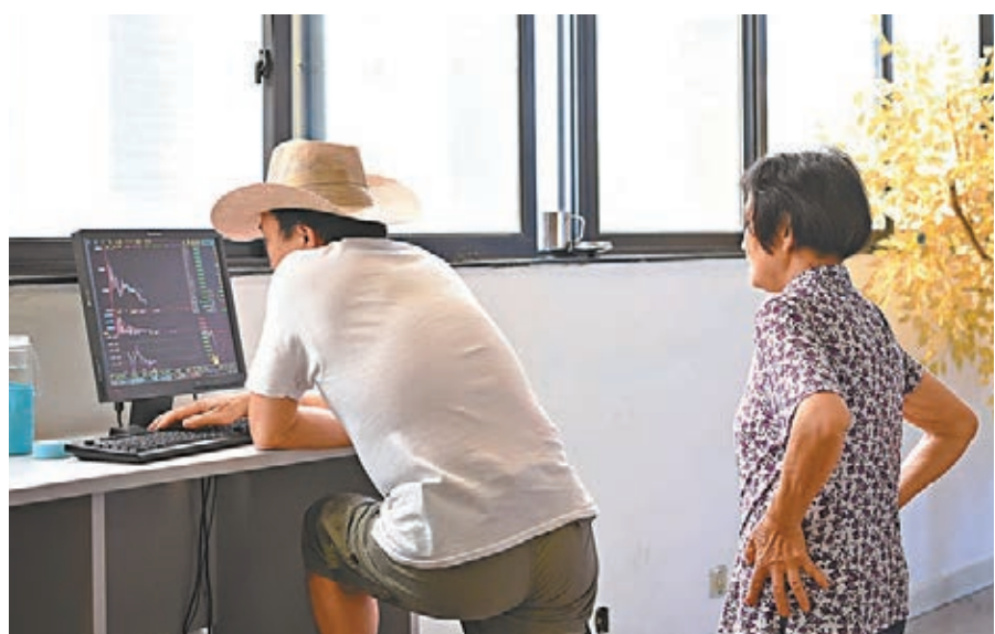
滬深A股昨天現分化，其中工程建設板塊個股持續漲停潮。

經過連續三個交易日上攻後，昨日滬綜指小幅回撤。滬綜指全日圍繞2,900點激烈爭奪，深市則呈衝高回落走勢。截至收市，滬綜指報2,903點，跌1點或0.07%，險守2,900點整數關口；深成指報9,463點，跌2點或0.02%；創業板指報1,632