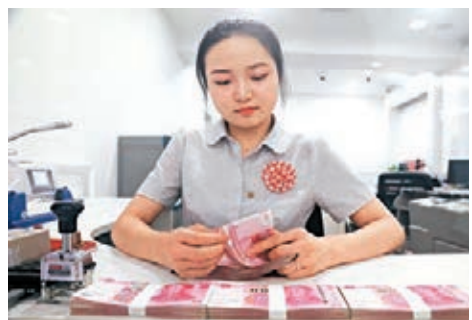
人民幣兌美元即期(CNY)昨天大幅收升，官方收市報6.7784。資料圖片

增長乏力背景下，中期人民幣仍承壓，短期則要看美指動向及監管層是否有方向指引。從「經濟數據、貨幣政策等方面看，人民幣貶值壓力還是有的。」