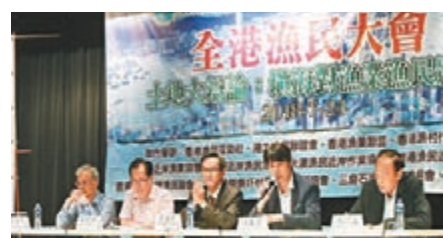
全港漁民大會及土地專責小組討論填海意見。

是次調查結果亦反映了救生員不足而影響泳池運作的問題,民建聯指,這情況已出現多年,批評政府一直都沒有正視問題,對泳客造成極大不便,更有可能危及泳客安全。