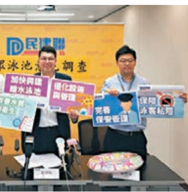
民建聯舉行公眾泳池意見調查發佈會。

主動增加設施,認為政府應檢討規劃。同時,部分泳池的設施日漸老化,甚至有設施損壞多時都無人修理或更換,以致有泳客需要長時間排隊等候使用設施。另外,康文署需加密洗池次數。