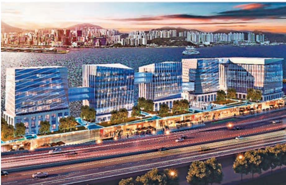
方案以「我的新中環」為設計宗旨,包括一層零售平台,及平台上以不規則設計的5幢建築。