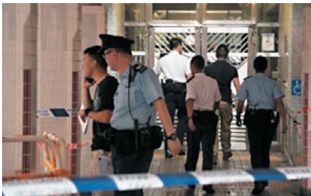
重案組探員到母子墮樓現場進行調查。