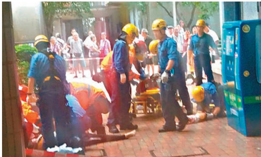
救護員為墮樓母子進行初步急救後，傷者由救護車送院治理，其中母親傷重不治。