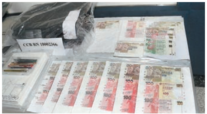
涉嫌管有偽製物料及器具、管有偽製紙幣。

香港文匯報訊(記者 蕭景源、鄧偉明)警方根據情報昨凌晨在土瓜灣一間酒店目標房間破獲偽鈔製工場，拘捕一對涉案男女，檢獲總面值9,100元的粗劣偽鈔製成品、一批複製工具及少量冰毒等證物。警方正追緝是否有偽鈔流出及去向，以及是否有在逃同黨。被捕兩人，分別26歲持行街紙的印度裔男子及19歲持香港身份證的英國籍女子，兩人為情侶關係，涉嫌管有偽製紙幣、管有偽製物料及器具、管有危險藥物罪名。據悉，近期相繼發生非華裔人士在交通工具或便利店嘗試使用偽鈔案件，警方正調查偽鈔複製工場與案件是否有關。早前南罪科接獲情報經調查，鎖定有人在租酒店房間製造偽鈔活動。直至