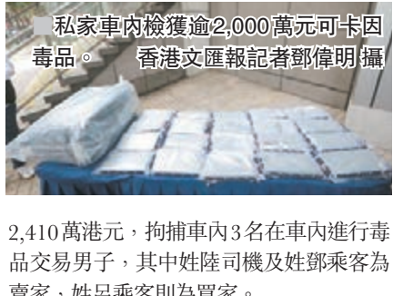
私家車內檢獲逾2,000萬元可卡因毒品。

香港文匯報訊(記者 蕭景源、鄧偉明)警方根據線報前日在八鄉破獲一宗毒品交易，在一輛目標私家車內檢獲逾2,000萬元可卡因毒品，當場拘捕3名涉案男子帶署查。被捕3名男子，分別53歲姓陸司機、32歲姓呂及49歲姓鄧乘客，本地人，部分人有黑幫背景，3人已暫控一項販毒罪，將於今日(25日)在屯門裁判法院提堂。