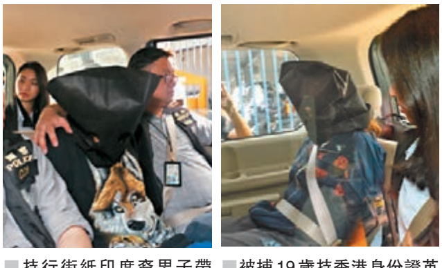
持行街紙印度裔男子帶同被捕19歲持香港身份證英國籍女子。

昨凌晨約3時，探員展開代號「雷霆18」行動，突擊搜查土瓜灣一酒店目標房間破獲偽鈔製工場，檢獲一批偽鈔製成品，包括14張500元、20張100元及2張50元，另檢獲一部噴墨打印機、