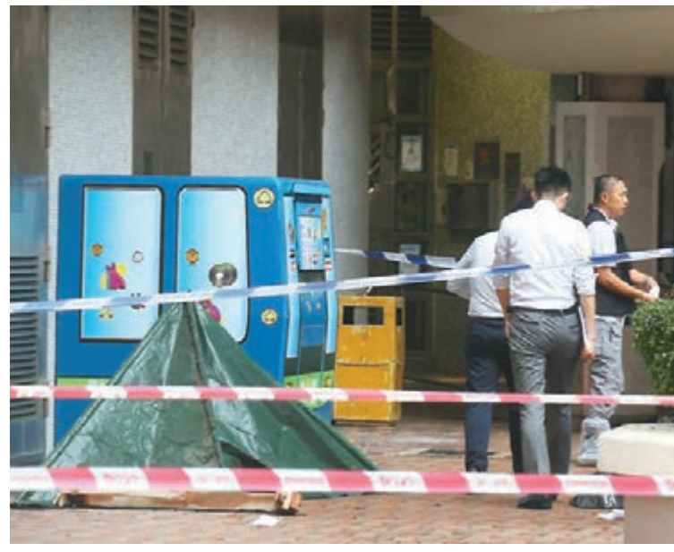
警員用帳篷將墮樓現場證物遮掩等候進一步調查。

香港文匯報訊(記者 蕭景源、鄧偉明)油塘發生懷疑母親攜幼子墮樓尋死倫常悲劇。一名疑有情緒問題單親媽媽，昨午趁大女及外傭離家期間留下遺書，先用刀自殘身體至鮮血淋漓，再與兩歲幼子從睡房窗墮樓重傷昏迷。母子由救護車送院搶救，母親傷重不治、幼子命危。警方正深入調查案發原因。