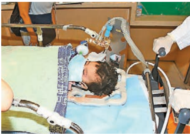
墮樓兩歲男童左前臂骨折及後腦重傷昏迷，送院命危。