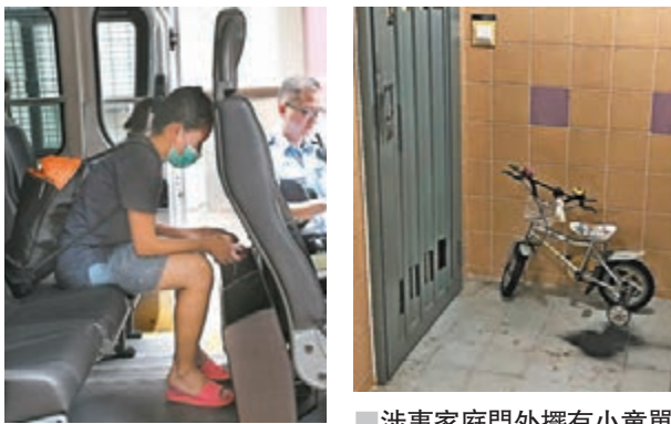
涉事家庭外傭外傭上警車車口供助查。

事發後，該服務中心的社工已接觸其家屬，以提供適切的支援。社署發言人呼籲，任何人士如在生活中遇到困難，可向當區的綜合家庭服務中心或致電社署熱線2343 2255尋求協助。