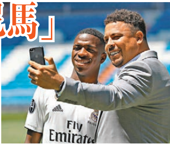
朗拿度(右)在歡迎會上，同雲尼斯奧斯自拍。