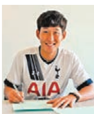
孫興民簽新合同。熱刺圖片

韓國球星孫興民日前落實續約熱刺到2023年。今年26歲的孫興民2015年從利華古遜轉投熱刺，迄今上陣140場攻入47球。他續約後說：「我們會繼續努力，我們配得上贏得更多東西，創造歷史。」