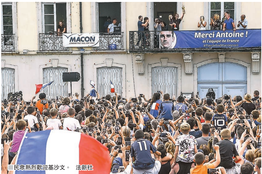
民眾熱烈歡迎基沙文。