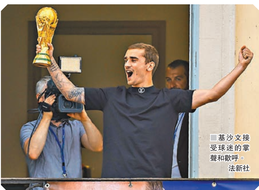
基沙文接受球迷的掌聲和歡呼。