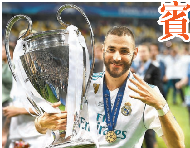
賓施馬隨皇馬成就歐聯三連霸。