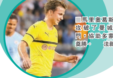
馬里奧葛斯剛攻破了曼城大門，協助多蒙特獲勝。