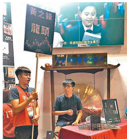
根本冇人龍，何來龍頭呢？香港文匯報讀者供圖