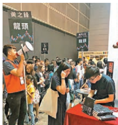
「噢，左邊好多人？但佢哋係買咗其他書等緊畀錢的人呢。」