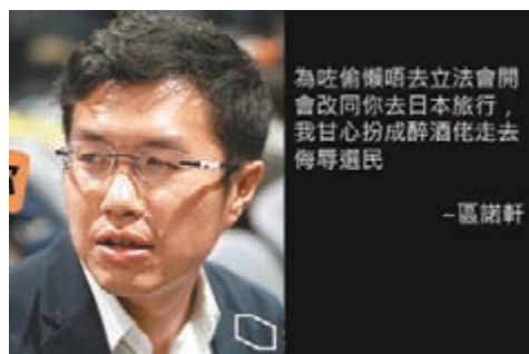
寸區諾軒陪太太遊日缺席投票。fb圖片