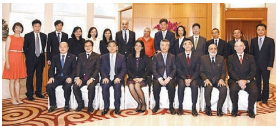
黃蘭發(前排右四)會見香港律師會新一屆理事會。

位，緊緊抓住國家「一帶一路」倡議和粵港澳大灣區發展戰略為香港法律界帶來的難得機遇，推動香港與內地法律服務的交流合作不斷向前發展，為維護香港法治和「一國兩制」成功實踐行穩致遠作出更大貢獻。 會見結束後，黃蘭發向來訪的全體理事贈送了《憲法和基本法》合訂本等書籍，理事們還參觀了中聯辦歷史展覽室、文體活動室等。