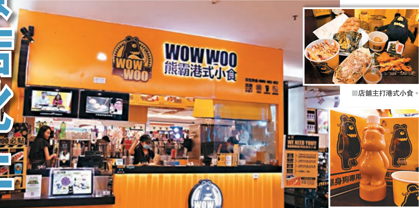
店舖主打港式小食。