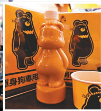
飲品包裝用上自創的熊霸。