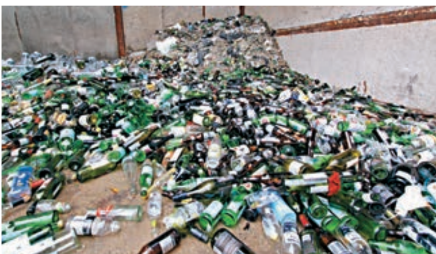
玻璃樽徵費計劃最遲明年中落實,初步估計每公升容器徵費約1元。圖為本港玻璃回收場。

灘 餐具先行」運動啟動後指出,玻璃飲料容器生產者責任計劃的主體法例已通過,現正進行相關及附屬安排,於明年逐步落實推展。政府已委聘承辦商在香港、九龍及新界三個地方起動,配套相關法例。