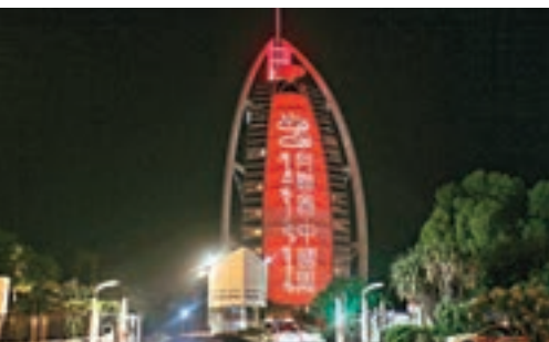
■ 迪拜有酒店已在大樓外牆打出「阿聯酋中國周」字樣。