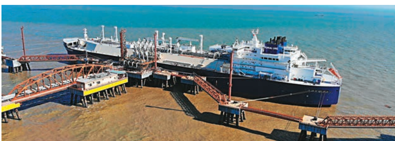
■ 載着北極液化天然氣的運輸船在江蘇如東LNG接收站卸貨。

香港文匯報訊 (記者 羅洪嘯 北京報道) 作為中俄能源合作重大項目的亞馬爾液化天然氣項目向中國供應的首船液化天然氣(LNG)昨日運抵中國石油江蘇如東LNG接收站，這是亞馬爾項目首次通過北極東北航路穿過白令海峽向中國供應LNG，