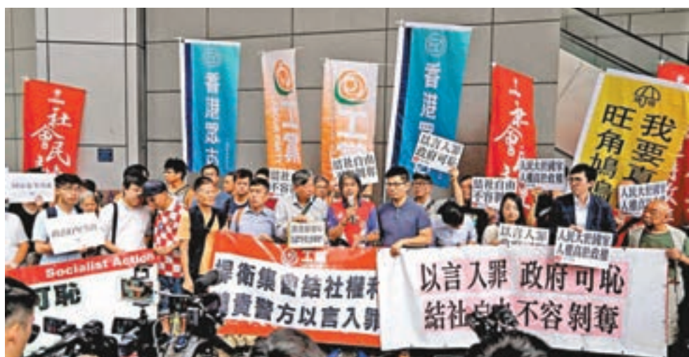
多個反對派團體昨日到警察總部示威施壓。

英國外交部前日發出聲明，稱知悉並關注「香港民族黨」一事。聲明雖然稱英國不支持「港獨」，但就聲稱香港的高度自治、人權和自由是香港生活方式的核心，必須得到「充分尊重」，又聲言香港基本法及《香港人權法案條例》保障了港人的選舉和被選舉權、言論自由和結社自由。