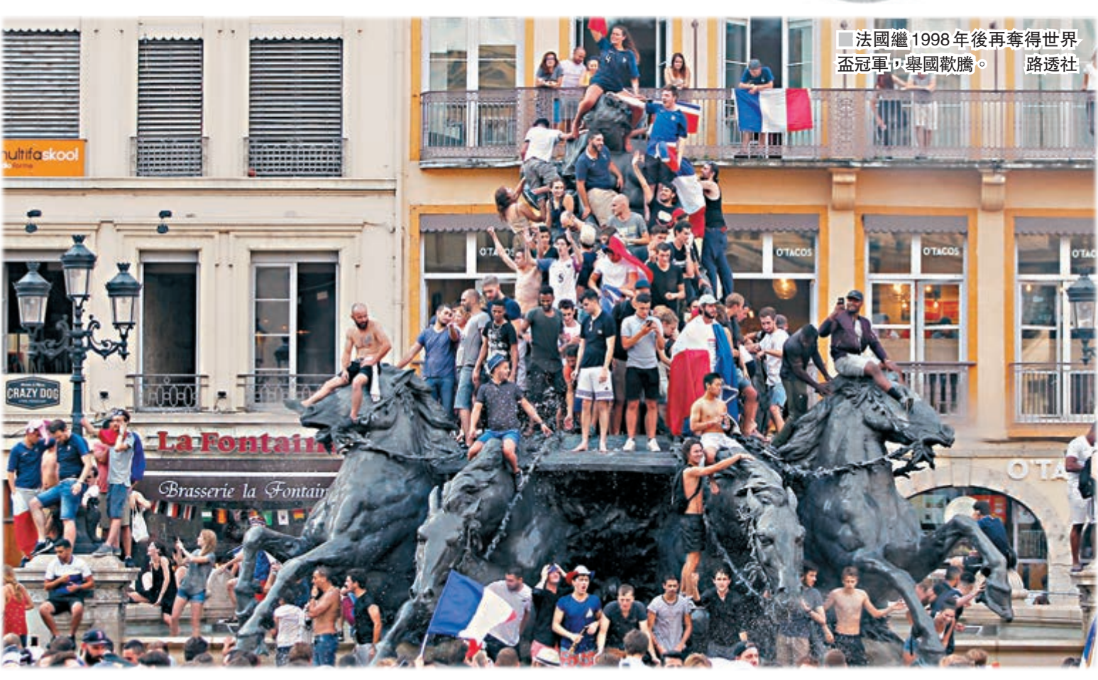
法國繼1998年後再奪得世界盃冠軍，舉國歡騰。