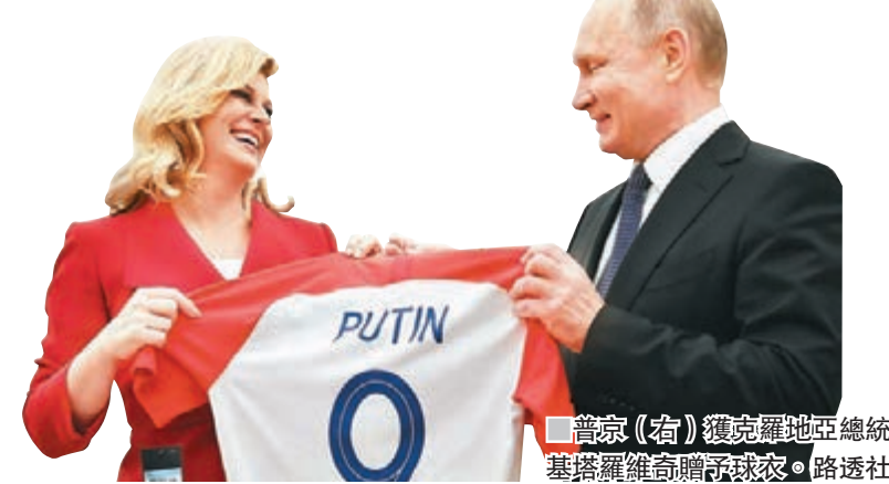
普京(右)獲克羅地亞總統基塔羅維奇贈予球衣。路透社

由於國慶日翌日適逢世盃決賽日，法國警方早已嚴陣以待，但仍阻不了世盃慶祝演變成衝突。巴黎的球迷在凱旋門前施放藍白紅三色煙霧彈，又爬上報紙檔和巴士站頂部揮動國旗。臨近午夜，球迷逐漸從香榭麗舍大道散去，但滋事者開始襲擊商舖，又向防暴警察投擲石頭、玻璃樽、臨時路障甚至單車，並焚燒垃圾筒，警方需出動水砲車和催淚氣體還擊，期間引發人踩人，新西蘭記者里德亦遭催淚彈所傷，直言「像被火燒一樣」。約100名青年在南部城市里昂與警方發生衝突，他們在直播比賽的市中心露天廣場上，爬上警車車頂，馬賽的衝突中亦有10名球迷被捕。 3童遭車撞 男子跳河慶祝亡 東部城市南錫市郊的慶祝活動中，一名3歲男童和兩名6歲女童遭電單車撞傷，東南部城市阿訥西則有一名50歲男子跳河慶祝時不幸折斷頸身亡。北部小鎮聖菲利克斯一名30多歲男子亦在完場後不幸開車撞向一棵樹喪命。 法國近年受恐襲陰霾籠罩，不少球迷認為國家隊相隔20年再次奪冠的意義重大，能夠重振國民信心和恢復團結，不再以宗教劃分界限。 ■路透社/法新社/美聯社