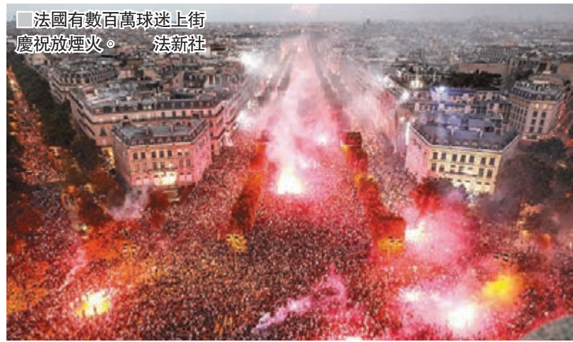
法國有數百萬球迷上街慶祝放煙火。法新社

6地鐵站為球員教練改名 為慶祝法國奪得世界盃冠軍，巴黎6個地鐵站昨日改名一天向球員教練致敬，其中田園聖母堂(Notre-Dame des Champs)站加上主帥迪甘斯的名字，變成Notre Didier Deschamps 站，意即「我們的迪甘斯」；以大文豪雨果命名的雨果(Victor Hugo)站，昨日也改為Victor Hugo Lloris 站，亦即決賽下半場大出洋相的門將兼隊長洛里斯的名字。香榭麗舍大道一端的「戴高樂一星」(Charles de Gaulle-Etoile)站，則更名為On a 2 Etoiles我們有兩星，意為法國第二度奪得世界盃冠軍。 ■法新社