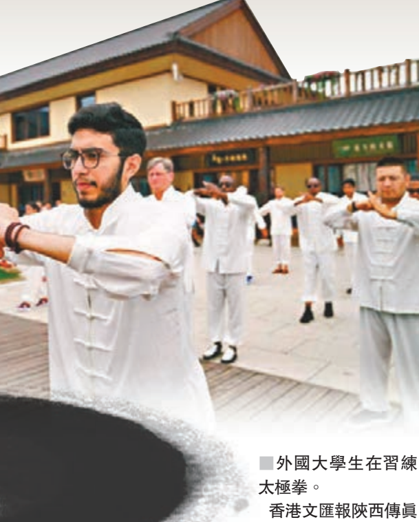
■ 外國大學生在習練太極拳。香港文匯報陝西傳真