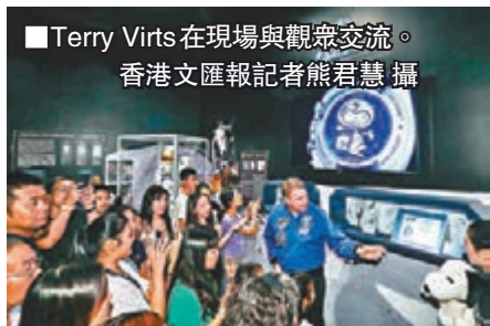
■ Terry Virts在現場與觀眾交流。

《星球奇境》宇宙特展（原名：Neighborhood Earth），講述人類探索太陽系的故事，展示NASA半個世紀以來的航天探索成果。2017年2月全球首展於美國太空與火箭中心舉行，同年9月來到中國。繼上海站、杭州站和北京站之後，《星球奇境》近日登陸深圳，這是華南地區首站，也是全球巡展的第五站。 在展覽現場，深港市民不僅可以欣賞到最新登陸火星的宇航服、360度環幕星球影院、穿越銀河星際的巨大蟲洞，更可以實地參觀1:1超高精度還原的國際空間站，觀看實時直播空間站宇航員的真實生活。