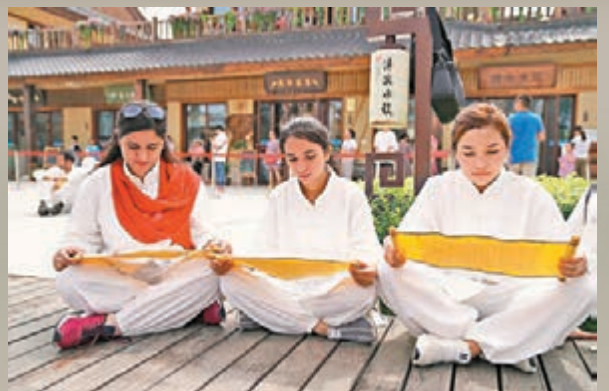
■ 外國大學生在吟誦《詩經》。

據悉，在為期10天的活動中，各國大學生將遍訪「絲路」歷史遺蹟，不僅將赴兵馬俑博物館、明城牆、大雁塔、西安易俗社、碑林博物館、關中書院、西安博物院等地參訪，還將吼唱秦腔、學習皮影戲，體驗「新西安人」的生活。