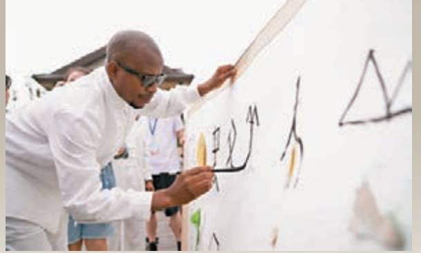
■ 外國大學生與西安小學生一起完成甲骨文書法作品。香港文匯報陝西傳真