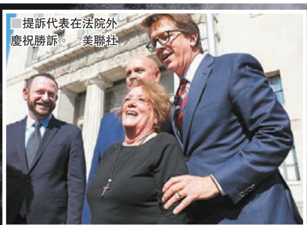
提訴代表在法院外慶祝勝訴。美聯社