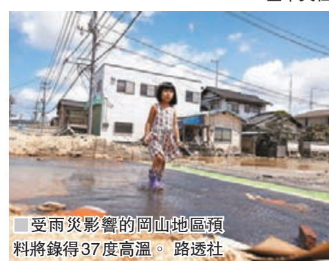
受雨災影響的岡山地區預料將錄得37度高溫。