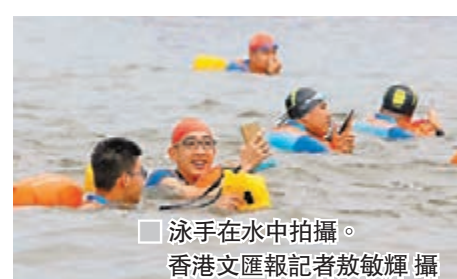
泳手在水中拍攝。

橫渡珠江活動也吸引了數萬觀眾在大雨中的珠江兩岸駐足。據主辦方介紹，今年橫渡珠江活動偶遇大雨，不過，組委會做