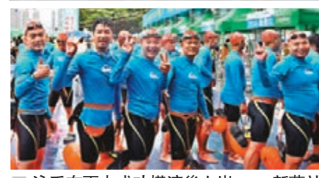
泳手在雨中成功橫渡後上岸。

了充足的準備，保障游泳者的安全。為倡導保護珠江「母親河」，自2006年起，廣州恢復舉辦橫渡珠江活動，至2018年已經連續13年。今年的橫渡珠江活動在中大碼頭至星海音樂廳之間的珠江河段舉行，活動的主題是全民健身、全民健康。 ■香港文匯報記者敖敬輝 廣州報道