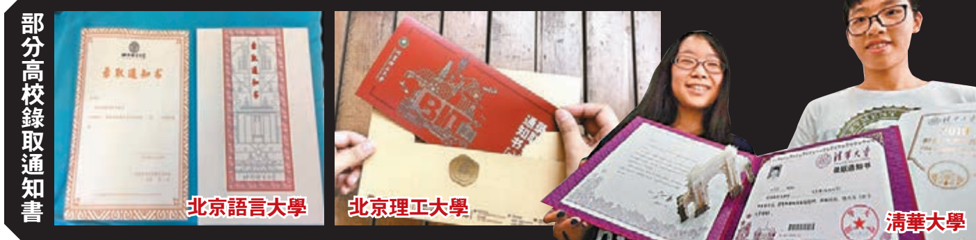
部分高校錄取通知書

2016年，北林曾花四個月設計出了將校訓與中國古典園林相結合的錄取通知書。去年，一份來自北林的時光禮物交給了2017級的「新綠」。主圖案由校徽中提取的三角形元素，其蘊含的山之堅毅，水之柔韌、木之繁茂、人之活力，也代表了每一顆「新綠」即將浸染的綠色印記。對於今年這份「走心」的豪華大禮盒，不少該校新生已經迫不及待，也有往屆生和研究生表示羨慕不已，提議開出購買渠道。