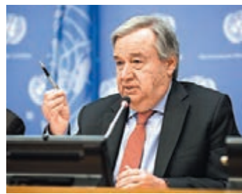
聯合國秘書長古特雷斯。