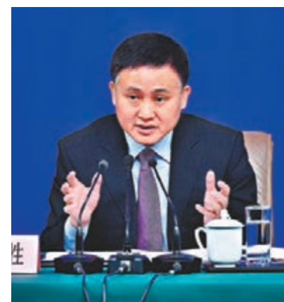
中國人民銀行副行長兼國家外匯管理局局長潘功勝。資料圖片

據《第一財經》報道，潘功勝在一論壇上指出，人民幣資本項目的開放目前存在着可兌換程度較低、便利性不高和交易環節約束較多等問題，因此，要從完善優化合格機構投資者制度等四個方面推進部署人民幣資本項目開放。四方面分別為：推動金融市場雙向開放，增加金融市場產品供給；完善優化合格機構投資者制度；完善互聯互通機制，擴大產品覆蓋範圍；以及支持金融機構參與國際金融市場，以推進部署人民幣資本項目開放。