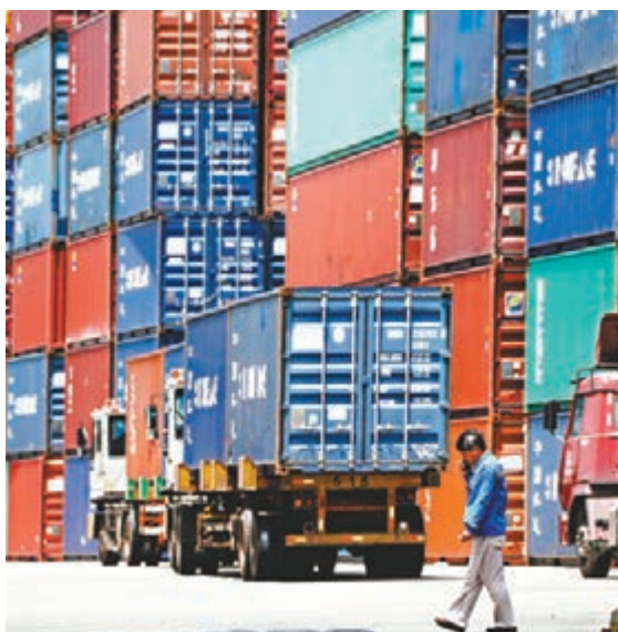
美國佔中國外銷比重的19%。

香港文匯報訊 美國公佈新關稅清單，將對2,000億美元的中國商品加徵10%關稅。外電引述多位專家指出，新一波課稅商品經過精心挑選，以免「傷人不成人反自傷」。清單上的部分項目明顯是針對「中國製