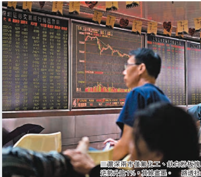
滬深兩市僅氟化工、鈦白粉板塊逆勢升逾1%，其餘盡墨。