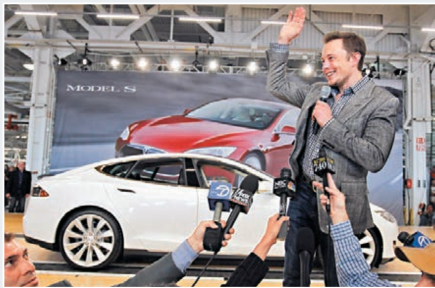
■ Tesla將在上海建廠,成為該市有史以來最大外資製造業項目。

香港文匯報訊(記者孔雯瓊上海報道)為進一步落實擴大開放,上海市在多個領域吸引外資。昨日市政府制定了「擴大開放100條」行動方案,聚焦五大方面,多行業放寬外資准入標準,推進更高層次的市場開放。新舉措即時有回應,美國最大的電動汽車特斯拉(Tesla)中國工廠落戶上海,成為該市有史以來最大的外資製造業項目。