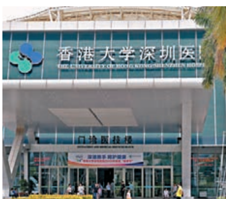
香港特區政府於2015年推出香港大學深圳醫院長者醫療券試點計劃。

據悉，陳肇始近日向媒體透露，醫療券在港大深圳醫院使用人數比預期多。隨着大灣區未來發展，不排除在大灣區內其他醫院或診所擴展醫療券計劃，正商討電腦技術、質素監管等配套問題，至於時間表、條件和在哪一所醫院推行，仍有待探討。