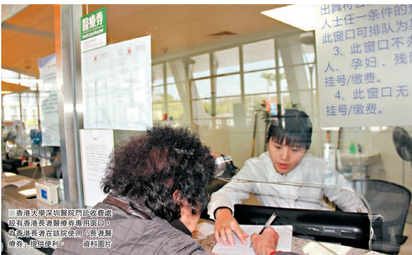
香港大學深圳醫院門診收費處設有香港長者醫療券專用窗口，為香港長者在該院使用「長者醫療券」提供便利。

對於兩地救護車的跨境互通，邵建波也表示期待。「在廣州生活的香港長者出現需要回港治療的情況，一般是患有急病，如果兩地救護車在通關口岸進行交接，需要提前清理通關口岸汽車通道，並由兩地救護車在通道內進行交接後再放行，這一環節耗時較長，往往會耽誤救治時間。」因此，他希望兩地政府再磋商後能給具備資格的醫院救護車配發兩地牌照，使就診時間進一步縮短。