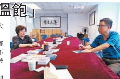
港歸長者關阿姨（左）和黃先生（右）。

另一位長者黃先生，同樣對內地醫院開放醫療券試點表示期待。對於回港治病的不便，他深有感觸。「每次回香港公立醫院看病，都要排隊等待很長時間，最長的時間甚至要六七個小時，一天來回根本不可能。」黃先生指出，如果增加內地的醫