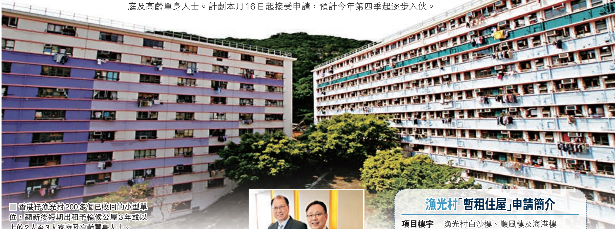
香港仔漁光村200多個已收回的小型單位，翻新後短期出租予輪候公屋3年或以上的2人至3人家庭及高齡單身人士。

房協計劃於5年後分期展開重建50多年樓齡的漁光村，並於鄰近的石排灣道一幅地皮興建安置屋邨。房協昨日宣佈推出「暫租住屋」過渡性房屋計劃，將200個因應重建計劃而騰空的小型單位，經翻新後短期出租予輪候公屋3年或以上的2人至3人家庭，以及「高齡單身人士」優先配租計劃申請人。該200個空置單位分佈於漁光村白沙樓、順風樓及海港樓，實用面積由14至28平方米。租金連差餉由560多元至1,400多元不等。1人單位佔10伙，2人單位140伙，餘下50伙則是3人單位，部分單位更設有露台。