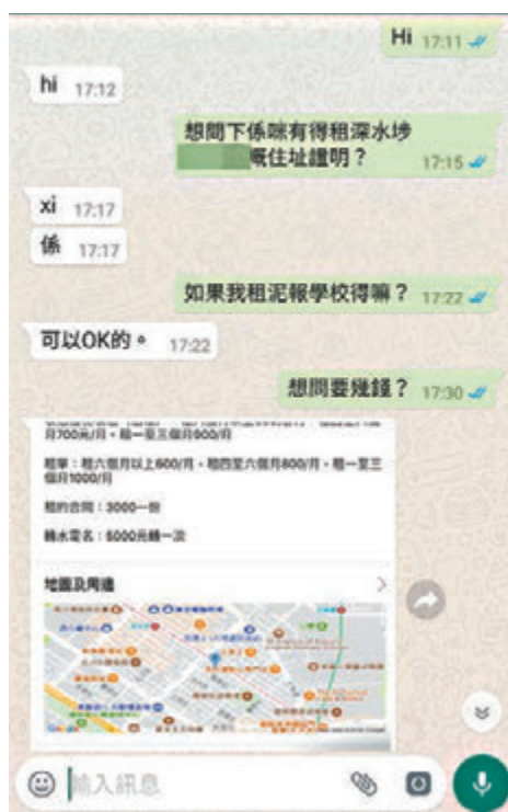
▲圖為用短訊問價的對話。