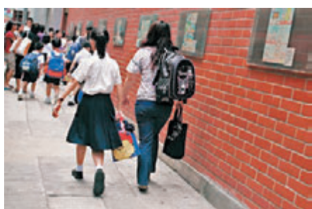
▲家長均希望子女讀心儀小學。