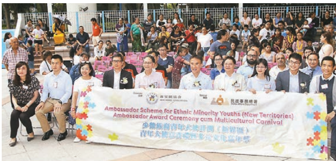
新家園協會舉辦「少數族裔青年大使嘉許禮暨多元文化嘉年華」。

以前進步及有更大的包容，少數族裔所受到的歧視比以往少很多，對於他們融入社會有很大的幫助。不過，他亦提到，現時政府對於少數族裔的支援的確比以前多，例如是教育支援比以前更全面，但在協助就業方面仍