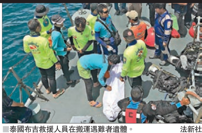
泰國布吉救援人員在搬運遇難者遺體。