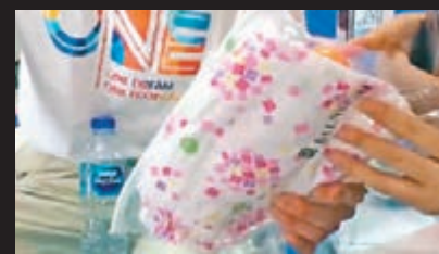
■ 鄭蘭慶 18 個月大的孫女留下的衣物和乒乓球。

香港文匯報訊 「全家只剩我一人了。」來自浙江金華 57 歲的鄭蘭慶守着妻子、女兒、女婿和 18 個月大外孫女的衣物，在泰國布吉瓦拉齊醫院等待，他心裡明白，隨着時間的流逝，親人恐怕凶多吉少。距離 7 月 5 日噩夢一般的觀光船翻覆事故已過去 48 小時，41 名中國遇難者遺體被打撈起，還有 15 人失蹤。鄭蘭慶只希望，早點找到親人們的遺體，親手為他們換上乾淨的衣服。