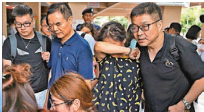
船上遊客的親屬到布吉醫院尋找家人，或核對死者名單。