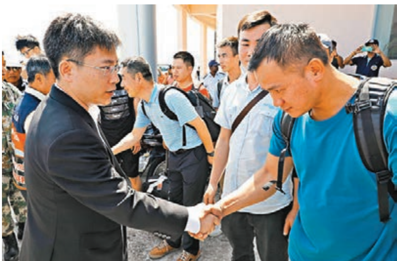
中國潛水員出發前，中國駐泰國大使呂健上前寄予囑託。

不過，來自中國的救援隊伍可能會在條件允許的情況下，繼續水下的搜救。據報道，7 日早上，來自中國交通運輸部的 10 人救援隊和來自浙江海寧的 7 人救援隊已抵達布