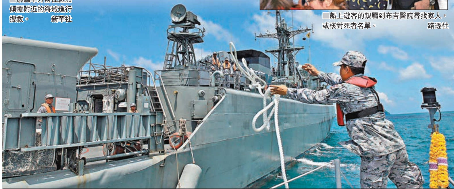
■ 泰國軍方前往遊船傾覆附近的海域進行搜救。