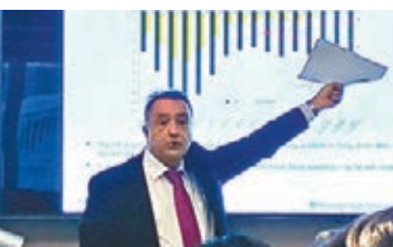
■羅卓夫料亞洲經濟發展仍會維持穩定。

宏利資產管理指，受亞洲受貿易摩擦影響，加上6月份美元升值及美國加息，亞洲股市投資者情緒亦受影響，但若股市進一步下