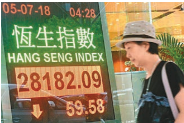
■港股昨一度跌逾400點，尾市收報28,182點。

場對高負債的海航系憂慮。CWT（0521）挫5.1%，東北電氣（0042）挫3.4%，香港國際建投（0687）挫3.7%，海航科技投資（2086）挫2.7%。至於真的發生債務違約的五洲（1369），復牌後曾急挫近19%，其間一度反彈，收市跌8%。