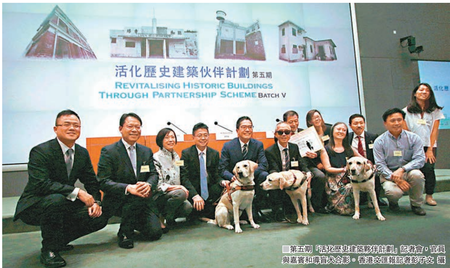
第五期「活化歷史建築夥伴計劃」記者會，官員與嘉賓和導盲犬合影。

香港文匯報訊(記者 殷翔)發展局昨日公佈第五期「活化歷史建築夥伴計劃」4個項目，中環舊域多利軍營羅拔時樓、粉嶺聯和市場、元朗前流浮山警署及屯門前哥頓軍營 Watervale House，將分別活化為藝展中心、傳統集市、導盲犬培育學苑、「心靈綠洲」等。4個項目合共所需3.83億元修復工程費及初期營運費由政府承擔，若順利通過立法會撥款，將於2022年至2023年陸續投入服務後，提供約124個職位。項目運行兩年後需自負盈虧。