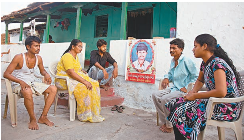
印度有男子因為拐帶兒童的謠傳而被暴徒打死。

項，頒發給就打擊虛假資訊提出解決方案的研發人員，並會將他們的方案與fb、學術界和制訂政策的官員分享。