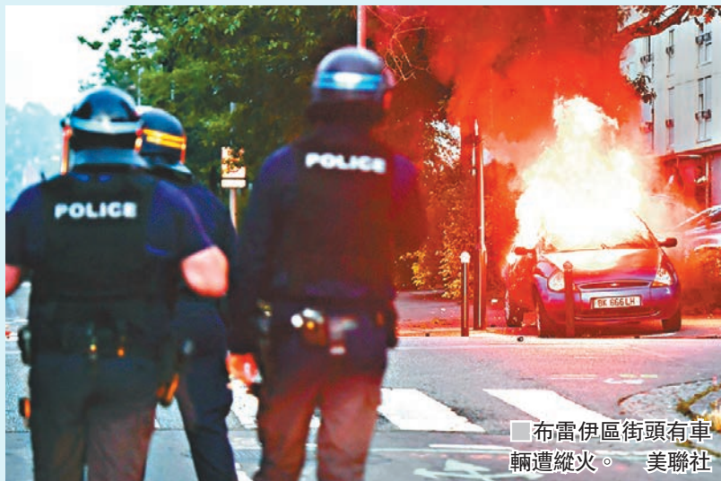
布雷伊區街頭有車輛遭縱火。