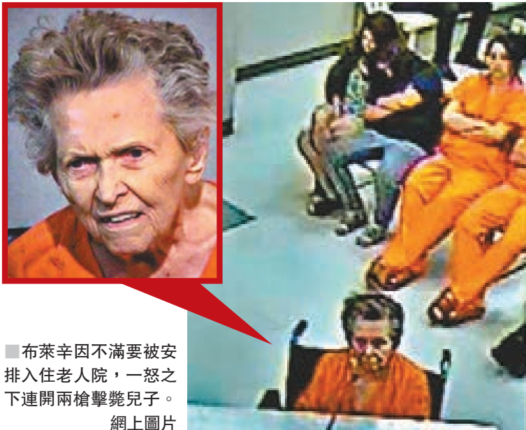
布萊辛因不滿要被安排入住老人院，一怒之下連開兩槍擊斃兒子。