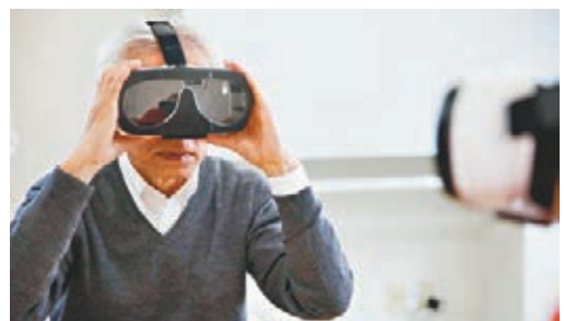
英國測試利用VR技術，協助認知障礙症患者尋回遺忘的記憶。