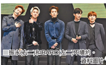
振永(右二)和BARO(左三)不續約。

對於B1A4由五人變成三人組合，不少粉絲們都大嘆難過，但還是會祝福5子往後的發展。