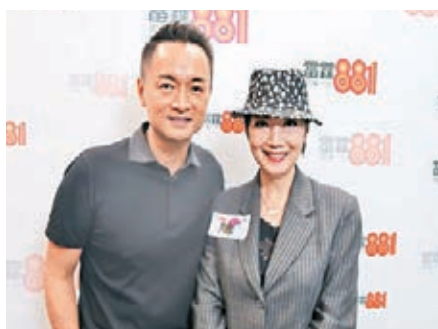
■心姐(右)透露任姐的離世確實對仙姐造成很大打擊。

而對心姐而言，任姐的離世是雙重打擊，因為她父親的離世只與任姐離世差一年。故此，她便決意轉當文武生，將傷痛投放在任姐的舞台藝術之中：「曾經我回來做戲的時候，習慣了任姐和爸爸坐在觀眾席的某個位置，一看，看不見，唉！雖然觀眾會拍手掌，但他們愈拍，我個心就愈痛，任姐和爸爸都看不到，那拍手掌為了什麼呢？所以我曾一度不想演戲，但回心一想就覺得任姐及爸爸都不會想我不演戲，這樣會浪費了任姐的栽培，於是我是1992年就轉做文武生。加上，那時我是中性的訓練，我的底功沒分是男是女，我又耳濡目染任姐的言行舉止，小至日常生活，大至舞台，全都印在腦海裡，所以我就想將她的舞台藝術以及我痛的心投放在這裡。」