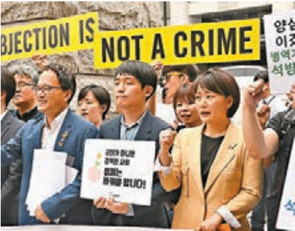
團體支持修訂《兵役法》。