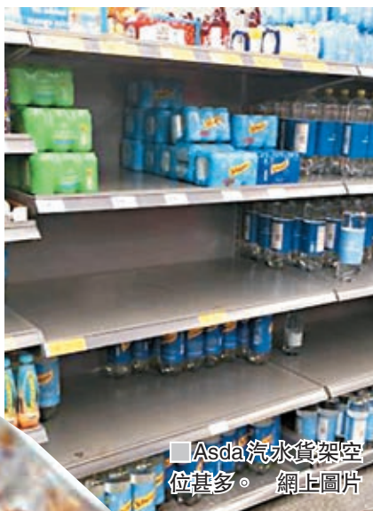
Asda汽水貨架空位甚多。 網止圖片