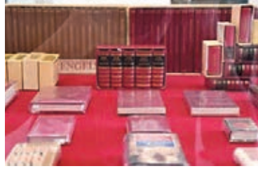
浙江義烏首次展出2,200種中外版《共產黨宣言》。

一個主題為「信仰的力量」的展覽近日在浙江義烏城市規劃館展出。210個白色展櫃整齊排列，113種文字、2,200餘種中外版《共產黨宣言》、200種《中國共產黨