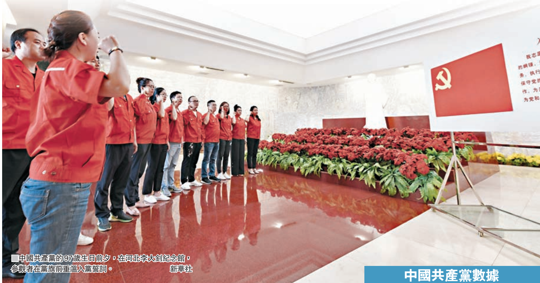
中國共產黨的97歲生日前夕，在河北李大釗紀念館，參觀者在黨旗前重溫入黨誓詞。

另據中央組織部最新黨內統計數據(見表)顯示，截至2017年底，中國共產黨黨員總數為8,956.4萬名，比上年淨增111.7萬名。黨的基層組織457.2萬個，比上年增加5.3萬個。數據表明，中央關於新形勢下黨員隊伍建設和基層黨組織建設的部署要求得到有效貫徹落實，黨的生機與活力不斷增強。