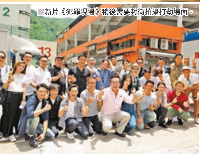
新片《犯罪現場》稍後需要封街拍攝打劫場面。