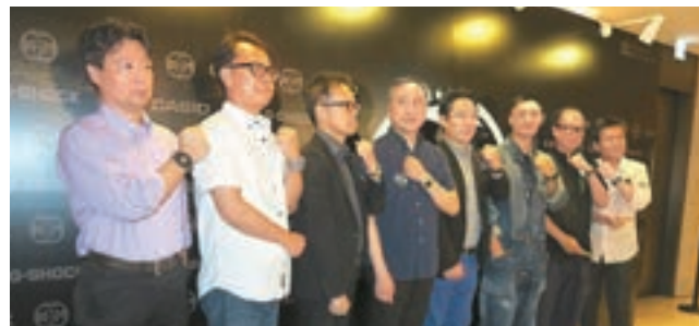
樂仔指工作在半年前已答應了做,所以不想推掉。

樂仔表示本來還在休假中,但這活動是半年前接下的,故此也要履行。他表示為照顧兒子已放了一個月假,推掉一切工作來幫太太湊B,問到現是否很棘手?他笑說:「努力中,自己揀了好位,負責餵奶掃風,媽咪負責換片,不過餵奶也很疲累,因每隔三小時就要餵一次,太太日頭餵,我就夜晚餵。」問他推掉工作是否損失了幾球(百萬)?樂仔笑答:「不只幾球(百萬),但不關錢事,只是不想(兒子)一出世我就走了去,想多放一個月假去照顧他。」問他是否辦好百日宴才復工?樂仔表示也差不多時間,但他不打算為兒子大搞百日宴,最多也是一家人吃餐飯。